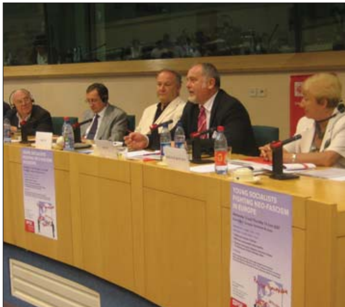
Antifasiszta konferencia az Európai Parlamentben

A MEASZ nemzetközi tevékenységének célja, hogy Európában hozzájárulhassunk az antifasiszta küzdelemhez és a szélsőjobboldali akciók visszaszorításához. Az utóbbi időben, hála erőfeszítéseinknek, a MEASZ nemzetközi tekintélye megnőtt.