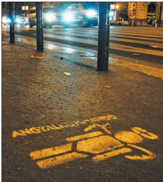
Az Angyalkommandó jelei az aszfalton