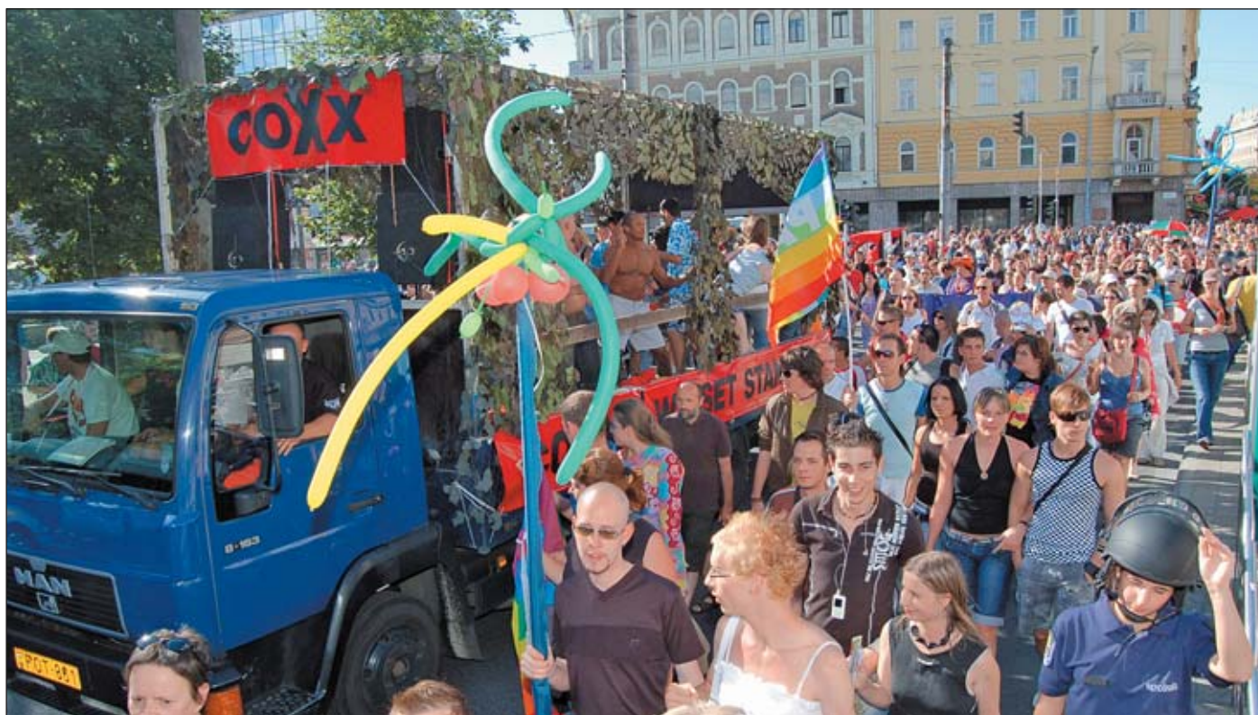
Férfiként próbálják ki, mi történik, ha kézen fognak egy másik fiút, és így sétálnak végig az Andrássy úton

A magyar viszont inkább telefonál a kőműves haverjának, és leszervezi vele vasárnapra a fürdőszoba-felújítást. Vidáman ugrik rá a lehetőségre, hogy megint sikerült egy közösségi