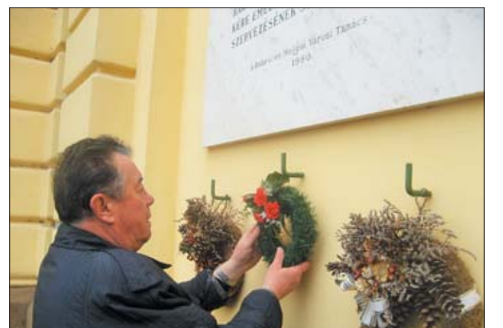
1945. március 3-án, 63 éve alakult meg az Új Magyar Hadsereg, amely a felszabadított oldalán vett részt a befejező hadműveletekben. A képen a MEASZ Hajdú-Bihar megyei elnöke koszorúzza meg a hadosztály emléktábláját