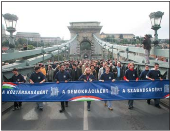
A Magyar Demokratikus Charta tüntetése

Gyurcsány Ferenc miniszterelnök a rendezvényt záró beszédében azt kérte a résztvevőktől, vigyék el az üzenetet, hogy létezik egy olyan Magyarország, amelyben megértés és béke honol, és ebben az országban mindenre szükség van.