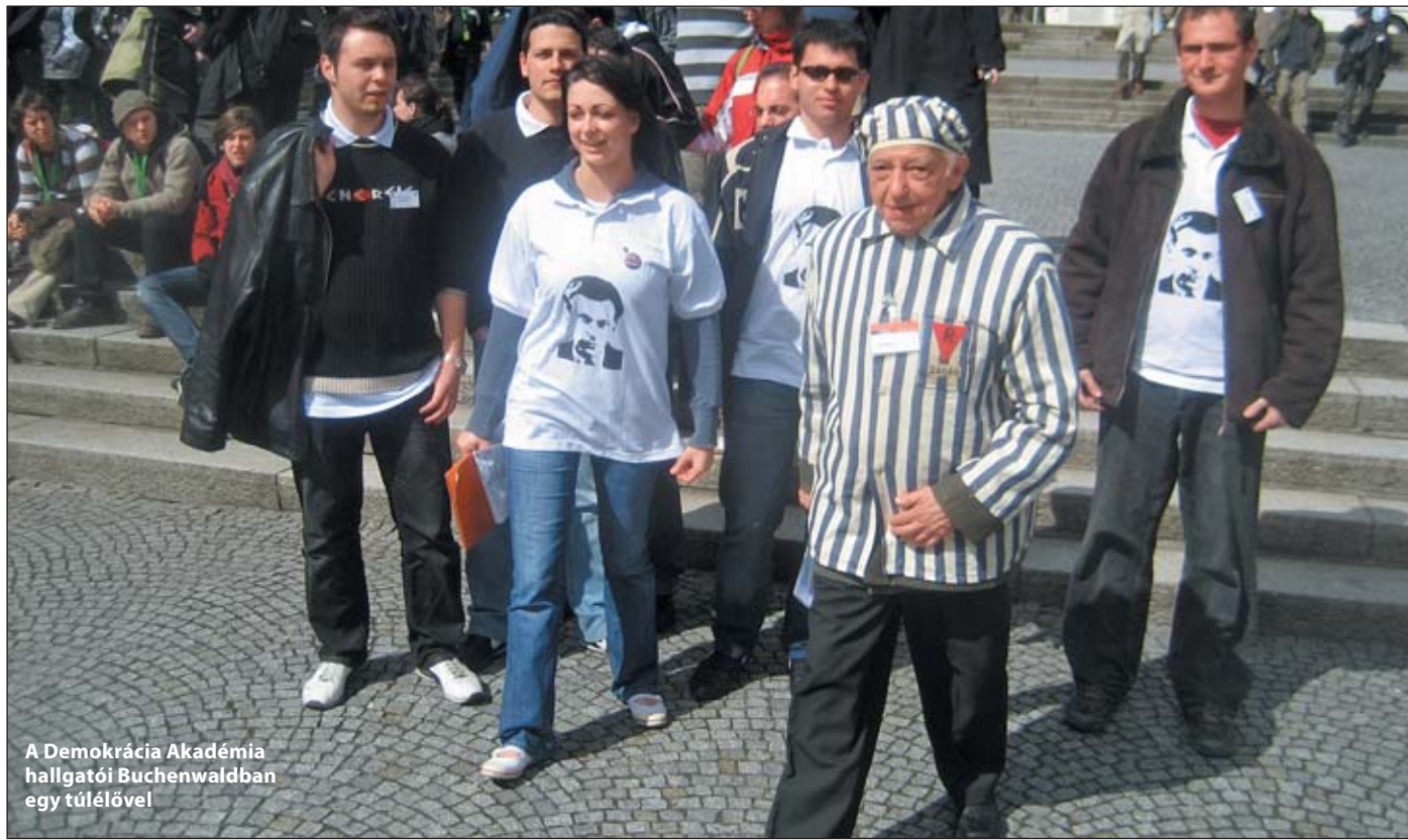
A Demokrácia Akadémia hallgatói Buchenwaldban egy túrlélővel

Jelentkezni 2008. október 28-ig lehet kizárólag a következő e-mail címen egy önéletrajz és egy motivációs levél elküldésével: measzelnok@chello.hu . A jelentkezéssel novemberben felvételi beszélgetésre kerül sor.