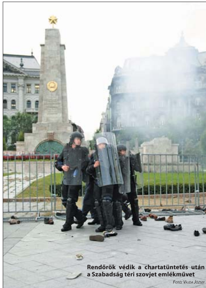
Rendőrként védik a chartatüntetés után a Szabadság téri szovjet emlékművet

Erősítsük meg a demokratikus értékrend szimbólumait! Február elseje legyen a köztársaság ünnepe! Méltó megemlékezés a II. világháború befejezéséről!